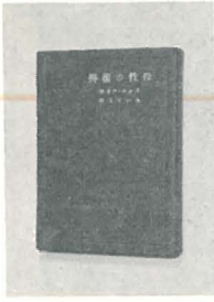
平塚らいてう訳 「母性の復興」 新潮社、大正8年

とは、恋愛なく結婚生活に入るのと同じく女性の墮落である。このどちらの場合でも子供が生まれれば、その女性は子供を盗んだことになり、それによって彼女の誇りは失われる。その誇りとは、かつては、子供の人間生活を成立させる最高の条件と確信されていたものであった。恋愛は——この言葉は何べんでも繰り返すが——未来を望むものであって、瞬間を求めるものではない。」(上—P. 189)