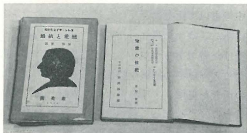
原田実訳「恋愛と結婚」 聚英閣、大正13年